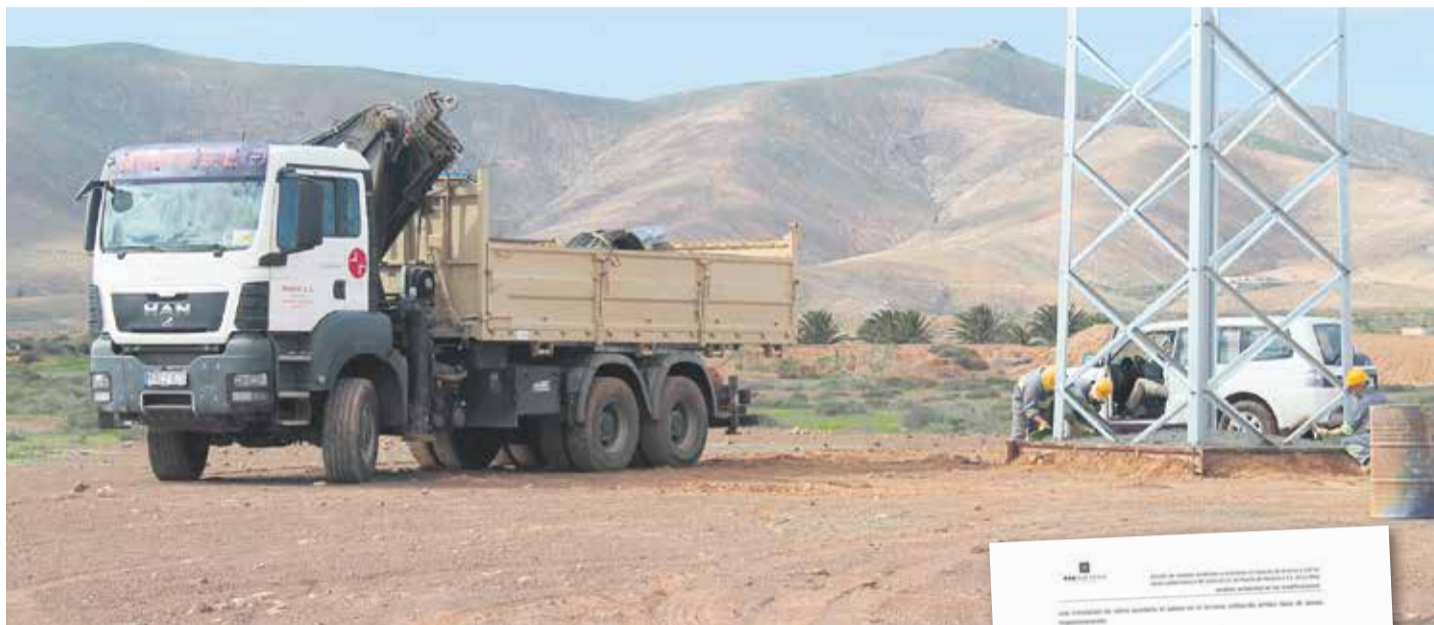
Instalación de una torreta. En la otra imagen los dos modelos posibles. El de la derecha es el modelo Haya.

En el apartado de conclusiones, REE señala que “la extensión de los mismos criterios de diseño a todo el eje contribuye a mantener una coherencia en el conjunto del territorio insular, y que utilizar diferentes tipologías de apoyos en los diferentes tramos del eje de transporte de energía eléctrica supondría una incoherencia poco defendible en un territorio insular, pudiendo ser considerado discriminatorio por los