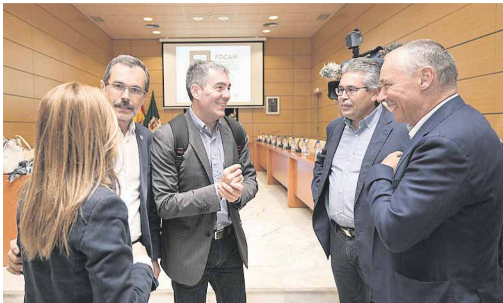
El presidente Fernando Clavijo, en una visita al Cabildo de Fuerteventura.

El Gobierno de Canarias descartó como criterio general el desdoblamiento de la actual carretera y a lo largo de buena parte de su trazado (a la altura de Guisgüey, Puerto Lajas o el polígono de La Hondura), la futura autovía discurre, hacia el interior, de forma paralela a la actual FV-1. La Consejería de Obras Públicas y Política Territorial aprobó en febrero del año pasado el proyecto, estimó en 89 millones de euros lo