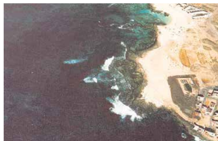
Encima de esta líneas, imagen de 1998, con arena donde se quiere levantar el hotel en la primera línea de costa de El Cotillo. Arriba, imagen área de la zona en 2016.