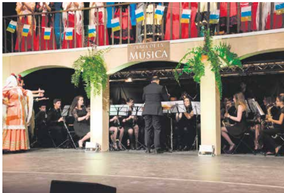
Zarzuela 'La verbena de La Paloma'.

Cuando nació, en 2007, la Asociación Banda de Música de Pájara ni siquiera pudo adjudicar la totalidad de los 25 instrumentos adquiridos para el préstamo a alumnos. Diez años después, y en puertas de su aniversario, la Banda cuenta con un banco de 52 instrumentos y tramita con el Gobierno de Canarias el código de centro para oficializar la escuela. Este paso burocrático, en el que la asociación lleva inmersa dos años, reportará ventajas a los alumnos, como contar con profesorado con titulación superior, la supervisión de las enseñanzas regladas por parte de la Consejería o la posibilidad de contar con un certificado final de grado elemental.