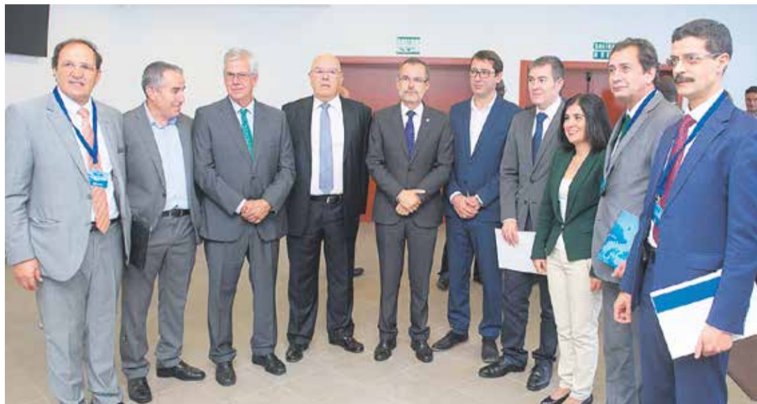
Imagen de una edición anterior de Africagua.

Los organismos e instituciones presentes en esta edición son el Banco Mundial, la Agencia marroquí de la energía solar (MASEN), la Alianza para la Electrificación Rural (ARE) de Bruselas, la Agencia de Promoción de Acceso Universal a los Servicios (APAUS), la Alianza Africana de Energías Renovables, y la Unidad de Preparación y Desarrollo de Proyectos de infraestructura (PPDU) de la Comunidad Económica de Estados