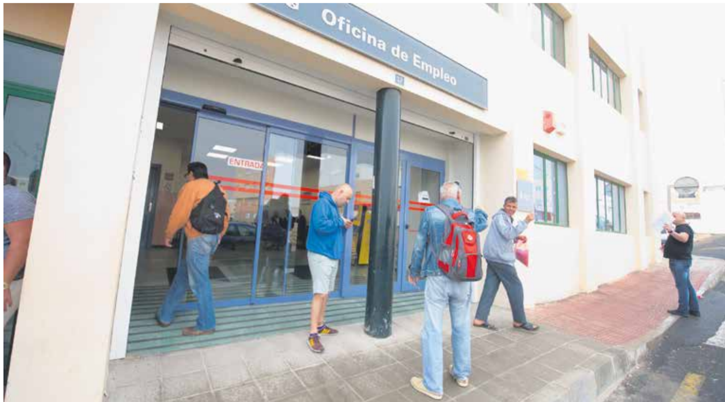
Oficina de empleo en Puerto del Rosario.

Todos los municipios de la Isla, salvo Puerto del Rosario, están en el furgón de cola de la provincia de Las Palmas en cuanto a los recursos económicos que tienen los hogares