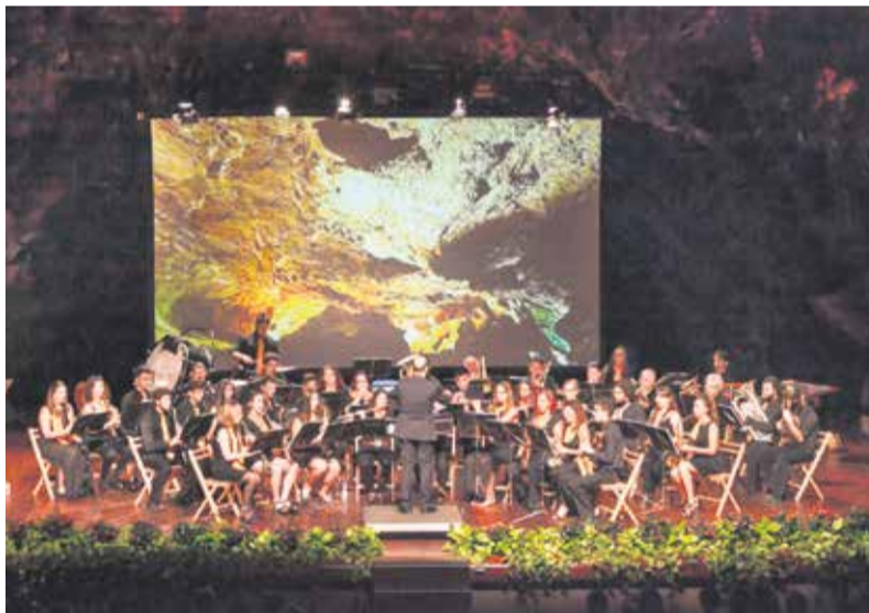
Actuación en los Jameos del Agua, dentro de las fiestas de San Juan de Haría, este año.