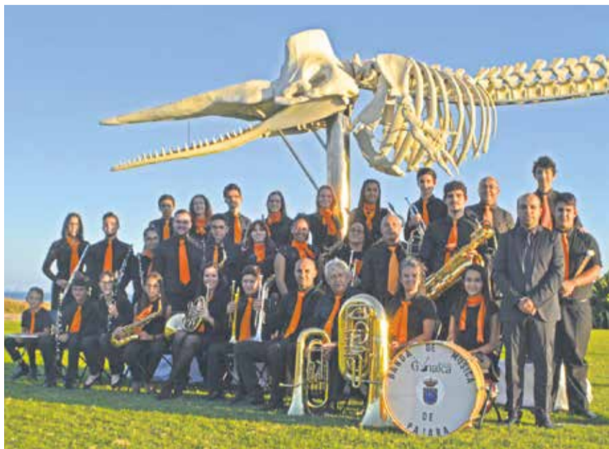
Miembros de la Banda, en Morro Jable.