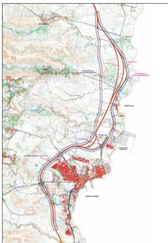
Plano con las diferentes variantes para la autovía entre La Caldereta y Puerto del Rosario.

sociosanitaria. El pasado mes de julio, el Ejecutivo regional anunció dos nuevos centros y el incremento de plazas hasta llegar a las 600 para mayores y personas con discapacidad.