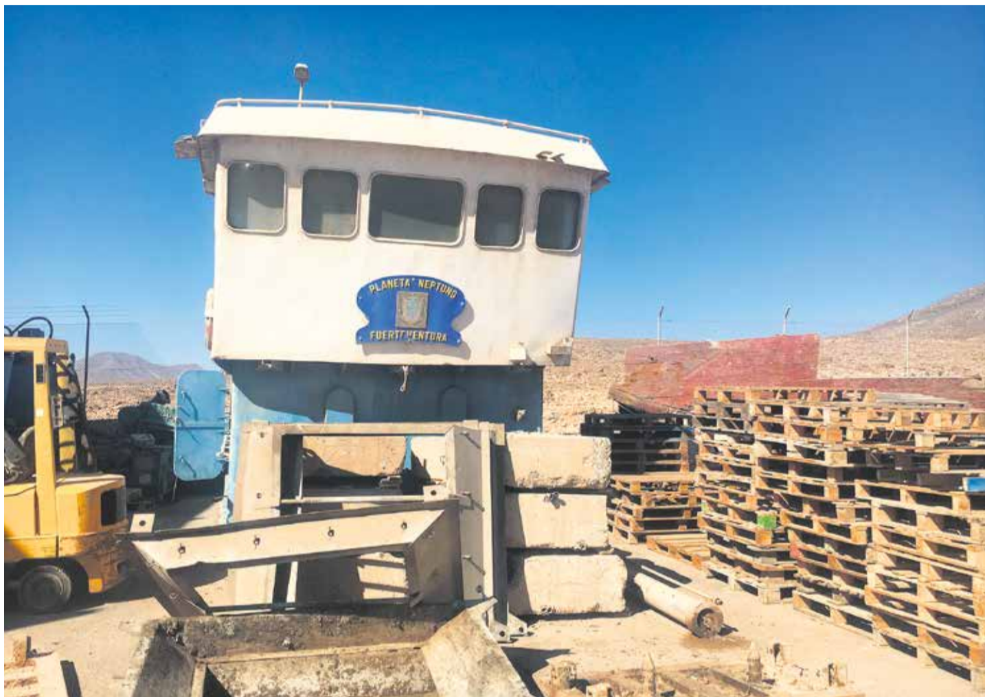
Estado actual del barco, en el interior del vertedero de Zurita.