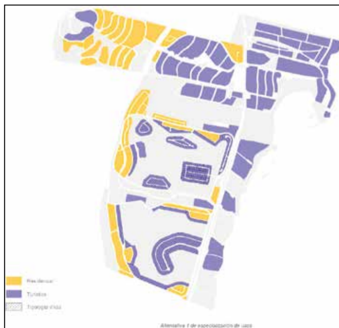
Alternativas de ordenación de Caleta de Fuste recogidas en el Plan de modernización que ha salido a evaluación ambiental, en el que se prima el uso turístico y la creación de grandes manzanas en la urbanización.