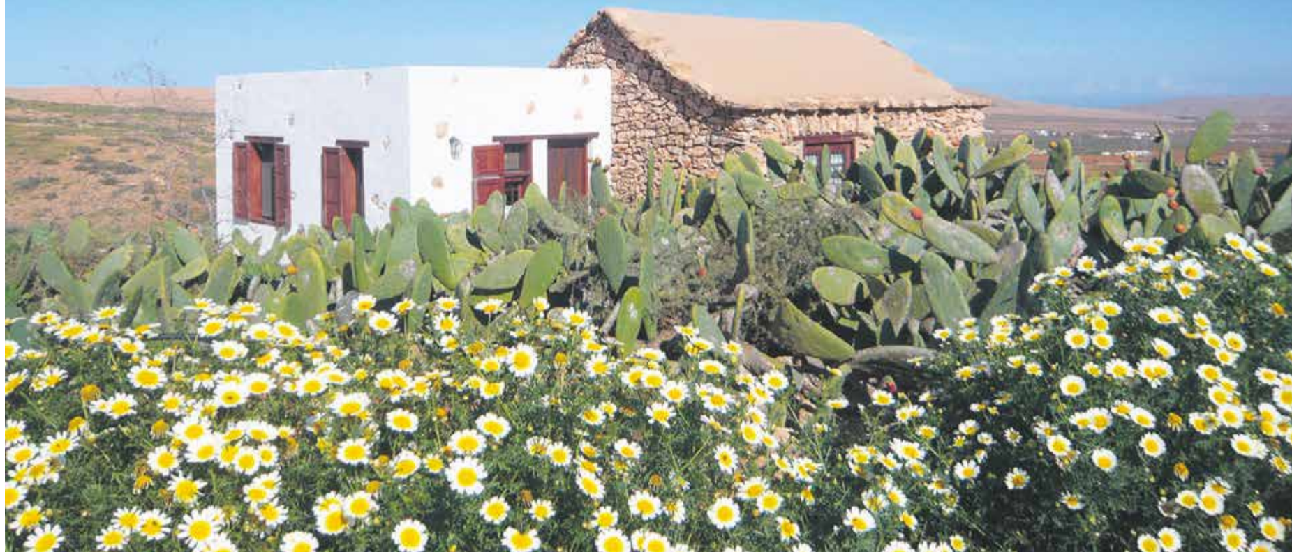
Casa Rural de la Burra en Los Llanos de la Concepción, propiedad de Marta Cabrera.

Las casas históricas luchan por hacerse ver y compiten con el alquiler vacacional y el 'todo incluido' en una Isla que elude el turismo interior